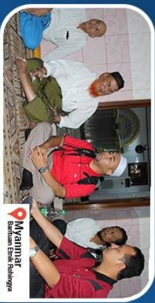
Myanmar Bantuan Bekal Makanan